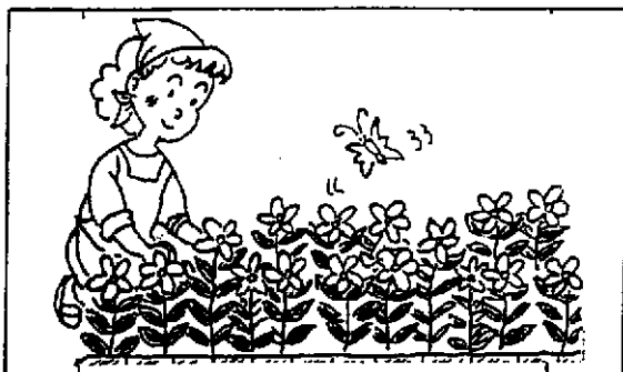
今年はこんなに咲きました！